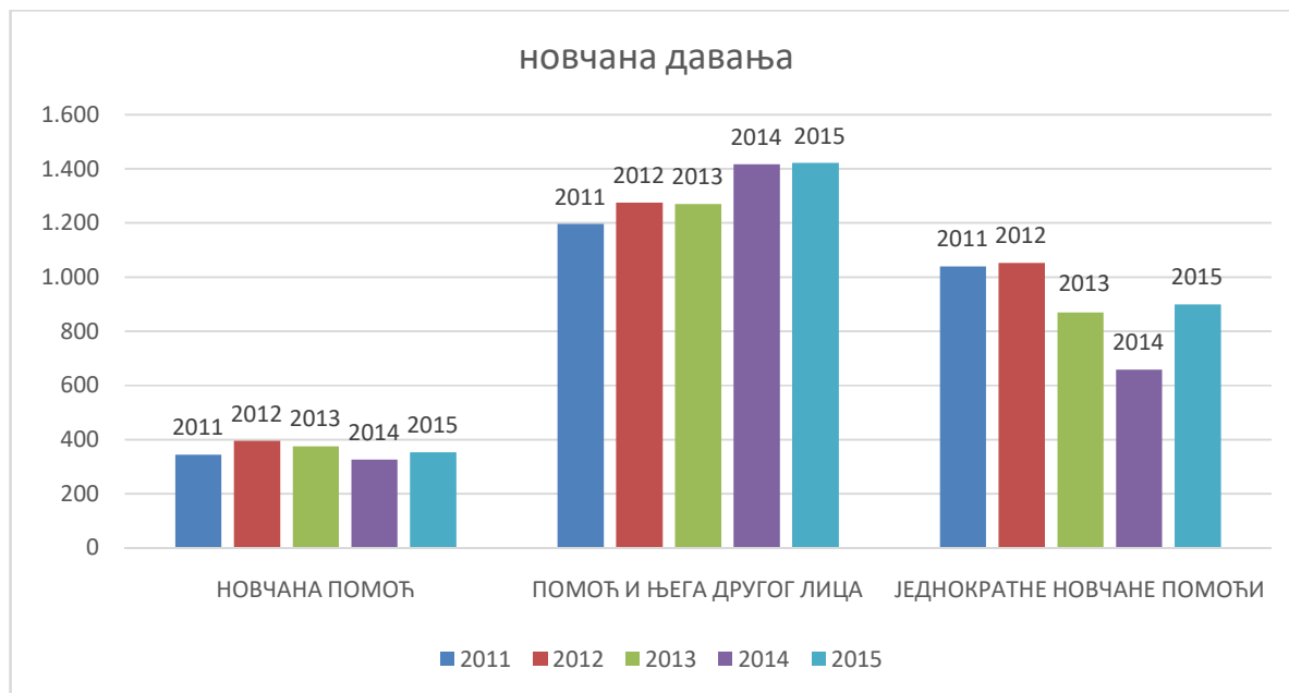
Т-6 Корисници новчаних давања – графички приказ