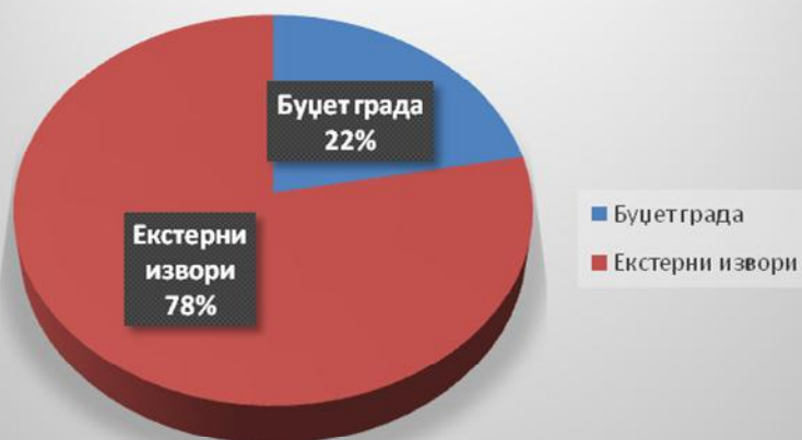
Графикон 2. Структура финансирања пројеката према извору финансирања

Екстерни извори подразумјевају кредит, државу, донаторе, али и јавна и приватна предузећа, с обзиром да су носиоци одређеног броја пројеката из Стратегије јавна и приватна предузећа који нису буџетски корисници као што су ЗЕДП „Електро-Бијељина“ а.д. Бијељина, МТЕЛ, ЈП „Еко деп“ и Неутрон д.о.о. Бијељина.