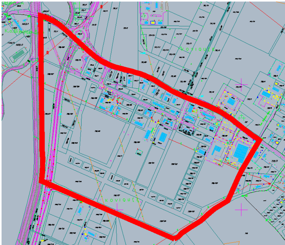
РП АГРО-ТРЖНИ ЦЕНТАР „КНЕЗ ИВО ОД СЕМБЕРИЈЕ“ – степен изграђености обухвата – 2022. година -