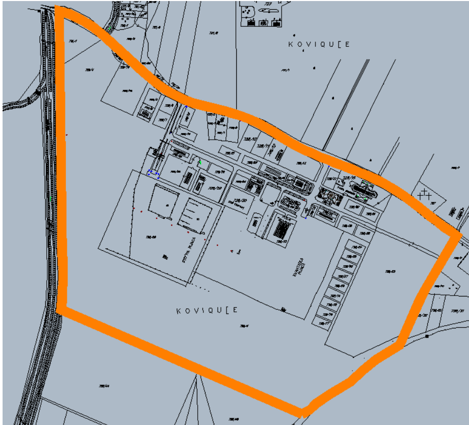
РП АГРО-ТРЖНИ ЦЕНТАР „КНЕЗ ИВО ОД СЕМБЕРИЈЕ“ – степен изграђености обухвата – 2005. година -