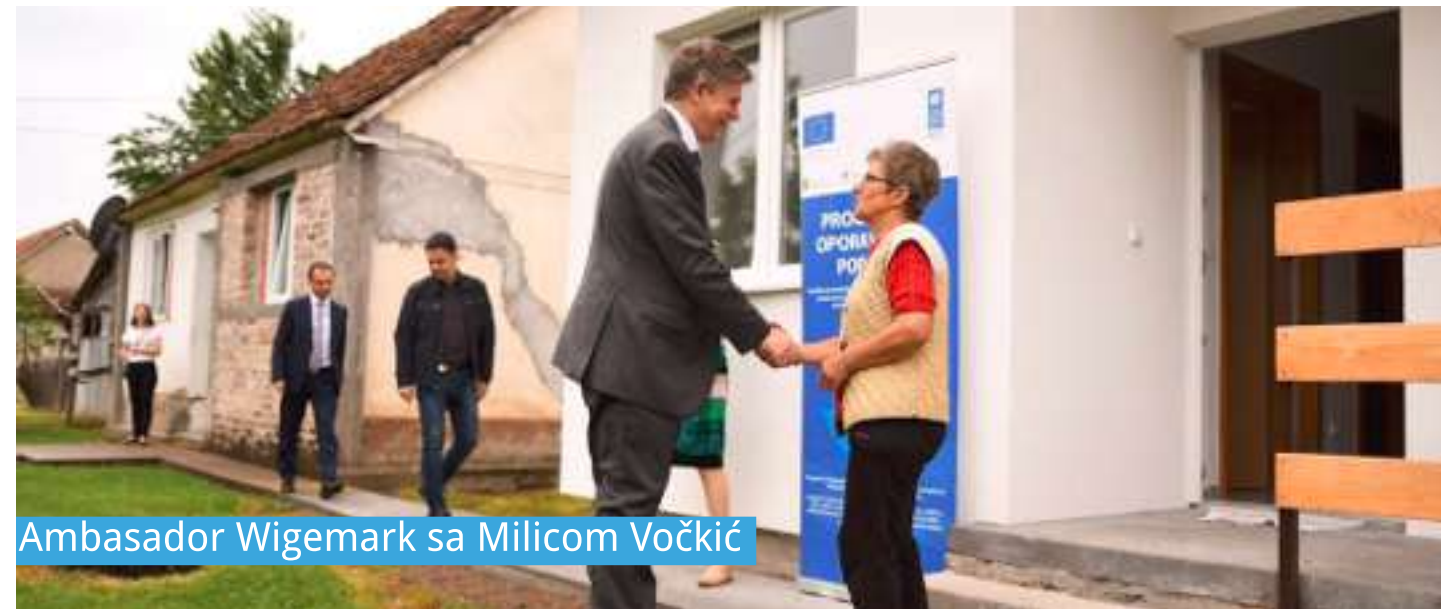
Ambasador Wigemark sa Milicom Vočkić

Ambasador Lars-Gunnar Wigemark, šef Delegacije Evropske unije (EU) i specijalni predstavnik EU u BiH, i Sukhrob Khoshmukhamedov, zamjenik rezidentne predstavnice Razvojnog programa Ujedinjenih nacija (UNDP) u BiH, posjetili su krajem maja 2019. godine opštinu Šamac gdje su se upoznali sa rezultatima pomoći koju su Evropska unija i UNDP obezbijedili za ovu opštinu u oporavku od poplava iz 2014. godine.