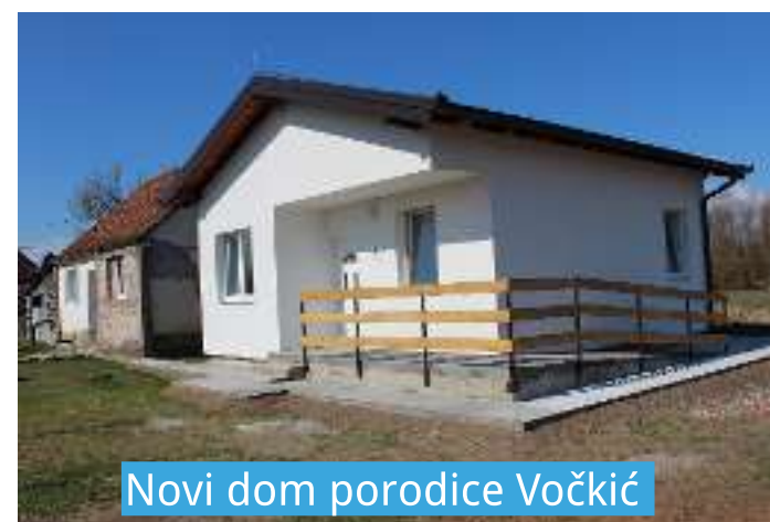
Novi dom porodice Vočkić

„Evropska unija je odmah bila tu da pruži podršku u procesu obnove i izgradnje nakon poplava 2014. godine, kao i u oblasti prevencije poplava“ kazao je Ambasador Wigemark. „Jedna od lekcija koju smo naučili je da možemo i trebamo sarađivati, jer su rezultati koje vidimo impresivni.“